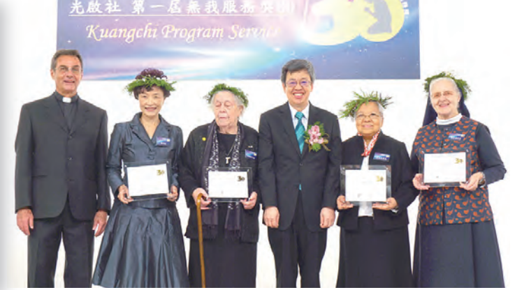
▲社福類得獎者左起：丁松筠神父、博愛基金會鄭榮顯董事長、聖安娜之家柯德蘭修女、頒獎人陳建仁副總統、安德蘭修女及羅麥瑞修女代表領獎。