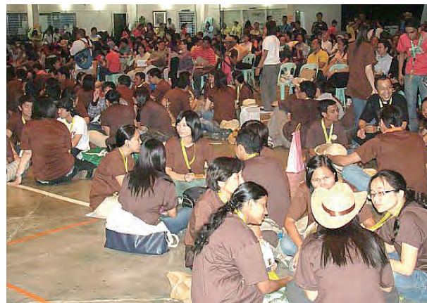
▲亞青隨時都在與各國青年交流

除了認識韓國的教會外，還認識了許多活力滿滿、試著用英文和我們溝通的韓國青年們，有當地的年輕人當導遊帶著我們走跳韓國大大小小的街道，直接地體驗韓國文化、美食、人們，更有一個溫暖的韓國寄宿家庭，體驗當地的日常生活，面對面的接觸韓國人的生活作息。走了一趟韓國，回到台灣後，讓我更加有動力繼續為天主做工，為祂服務，感謝天主！讓我們一起學習耶穌及殉道者的精神，亞洲青年醒來吧！Asian Youth! Wake Up!