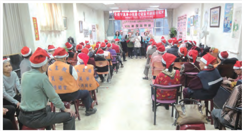
▲瓦器合唱團美聲溫暖長者的

會，博愛基金會也提供聖誕禮物致贈社區長者。特別感謝小德蘭堂老人據點志工團隊的合作與熱忱的服務。最應該感謝的是社區獨居、貧困、視障朋友，因著這些久未出門及行動不便的長者，在志工的邀請陪伴下，願意走出來參與我們的盛會，才使得這次的活動特別有意義。