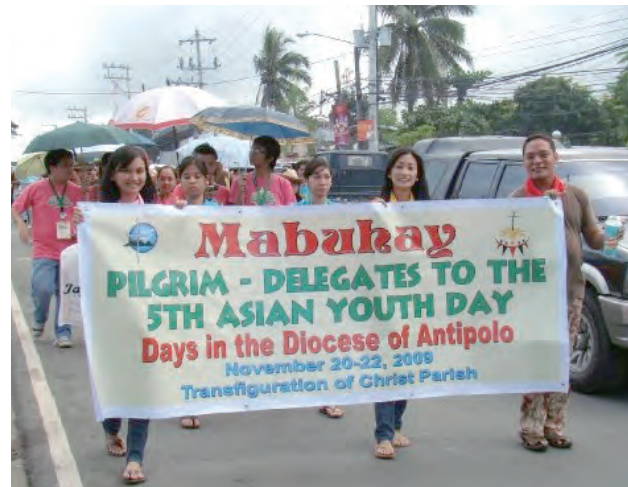
▲與各國青年一起遊行

因此，若對這類國際間的朝聖活動有興趣參加的青年們，亞洲青年日是個不錯的開始。由於活動時間較短，地點又位於鄰近的亞洲圈，花費就不會像世界青年日那般高昂，文化衝擊、水土適應上的差異也可能比較不那麼劇烈，對於初次造訪其他國家的朝聖活動，是個理想的選擇。