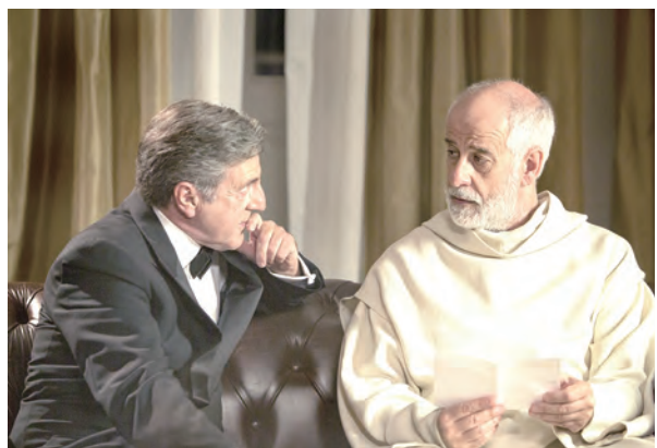
▲一次告解引起各方猜測，教友們可以更理解和好聖事的聖神性。

我深深認為，教友及非教友在觀賞這部片的感受應該有所不同。不清楚教會禮儀的觀眾在看的時候會感到疑惑，神父只要說出真相就能從麻煩中解脫，為什麼不說呢？但我自己在觀賞時是緊張地想，他們不應該逼迫神父講出告解的