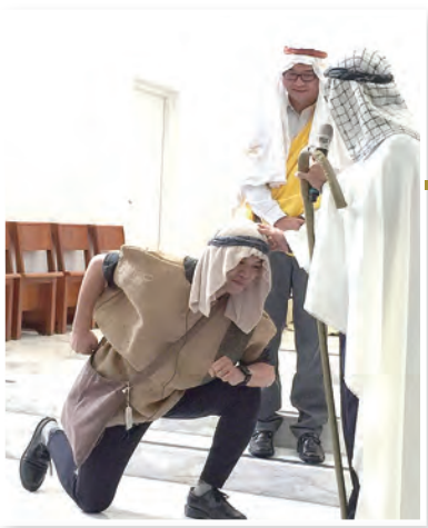
▲永和堂傳協會非專業卻用心的演出，引爆台下觀眾的笑聲與熱烈迴響。 ▶聖詠團以七部人聲無伴奏的阿卡貝拉方式演唱，揭開聖誕嘉年華會的序幕！