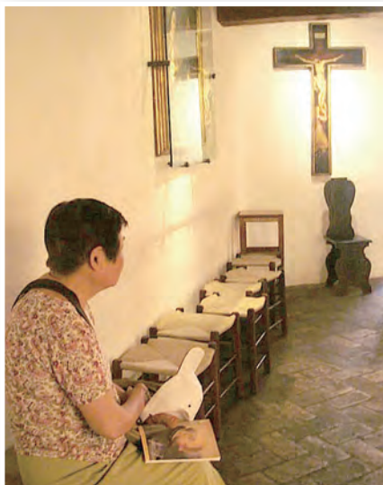
▲靜坐在光影中聆賞，每一件經典藝術都蘊生轉化為劉教授的深刻靈修養分。