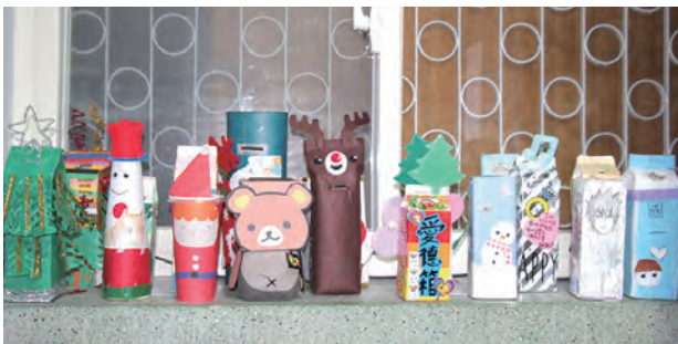
▲各班精心設計的愛德箱，裝載著光仁中學全校同學的愛心。 ▲聖誕禮讚演出聖誕話劇，提醒大家把冷漠變成愛，以實際行動實踐愛的精神。