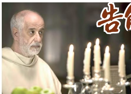
▲告解高峰會裡的神父謹守神職人員的嚴規，絕不退縮。

台北02-2371-0447 · 台中04-2220-4729 · 高雄07-261-2860