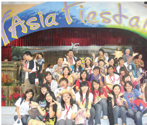
▲2009年菲律賓閉幕彌撒後，台灣代表團大合照。背景上面的Asia Fiesta是該屆亞青的口號