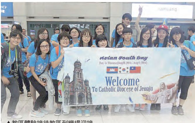
▲教區體驗接待教區到機場迎接 ▲2009亞青期間閉幕彌撒後，菲律賓的塔格萊(Tagle)主教(現為樞機主教、馬尼拉總主教)接受台灣代表團的致意與禮物