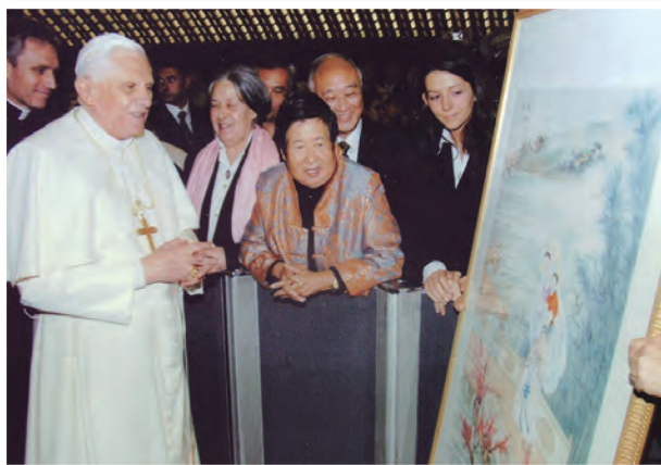
▲劉河北教授呈獻親手繪製的〈聖母抱嬰聖〉彩墨聖畫，給教宗本篤十六世，教宗非常喜歡，與她深入討論。

這個漣漪，在翡冷翠，我們師徒3人落腳的三星「B&B」，在老師曬了一整天炎陽，從修道院到博物館，傳道、授業、解惑之後，在我們分享從拐角小食鋪秤兩賣的托斯卡尼家常菜和葡萄酒後，終於把自己拋到床上，手執玫瑰念珠頌禱時，我看見漣漪層層擴散開來。（本文原載於《恆毅》雙月刊2011年10月）