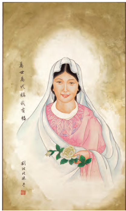
▲劉河北教授所畫的〈聖母像〉神韻極佳，深得聖母謙卑順服、溫柔慈愛的髓味。

尋親探舊，給大師上墳，一座座墓碑，就是在羅馬永城，劉老師給我們領路的座標，其中隱藏著屬於「十字孝女修會」（ Fille de la Croix ）的特別神恩？地上，地下，羅馬城簡直是活生生的人間墳場：聖伯多祿大殿建在伯鐸墳上，若望大殿奠基在聖史若望聖髑上，保祿大殿蓋在保祿墳上，三泉隱修院建於保祿頭顱被斬落地連三跳的觸地泉湧處，聖方濟薩威的一截胳膊與聖依納爵墓相對，一東一西共同撐起耶穌會大殿；耶路撒冷大殿內，君士坦丁大帝的母親——聖海倫從耶路撒冷攜回6件聖髑，其中包括耶穌荊棘冠冕