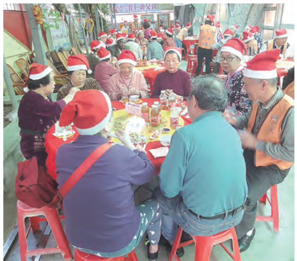
▲聖誕餐會，銀髮共融。